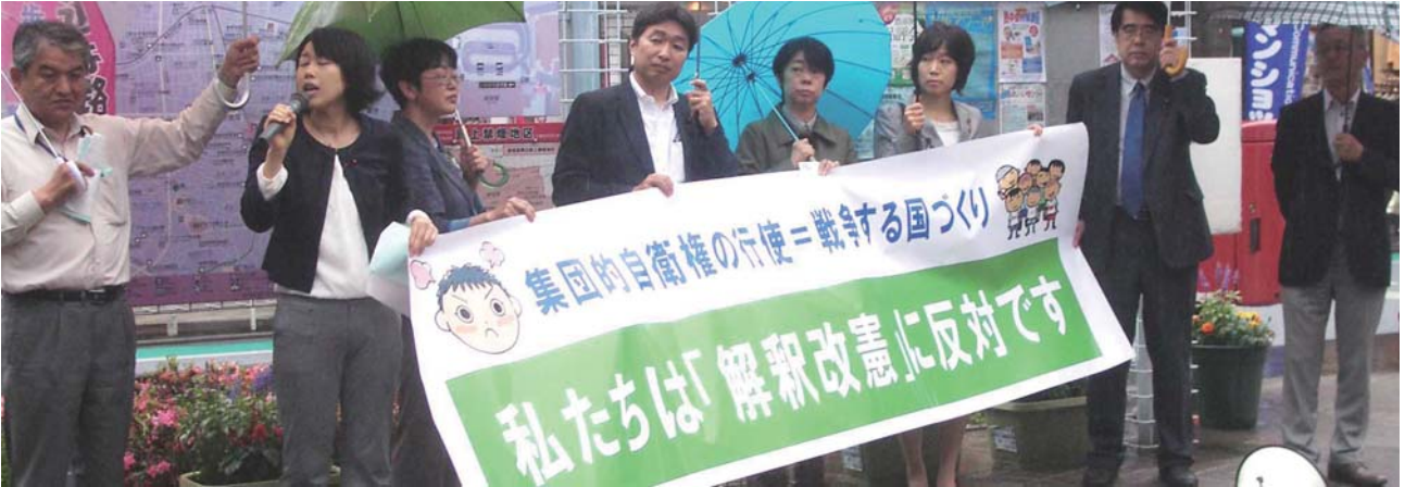
超党派議員による街頭アピール行動（6月7日、経堂駅）

区議会第2回定例会で超党派の議員が提案した「解釈改憲による集団的自衛権行使容認に反対する意見書」に、日本共産党、生活者ネットワーク・社会民主党、民主党など18人の区議会議員が賛同しました。自民、公明などが反対し否決になりました。また、それに先だつ7日には解釈改憲反対の一点で、超党派区議による街頭アピール行動を行いました。昨年12月の秘密保護法反対での共同行動につづくものです。