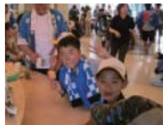
新潟県長岡市・小規模特養ホームに併設 された小規模多機能施設での地域交流の ようす（厚生労働省 HP より）

小規模特養ホームなどが 併設されていれば、自宅で の生活が難しくなった場合 に、引き続き同じ環境での 生活が可能となります。（小 規模多機能型居宅介護）