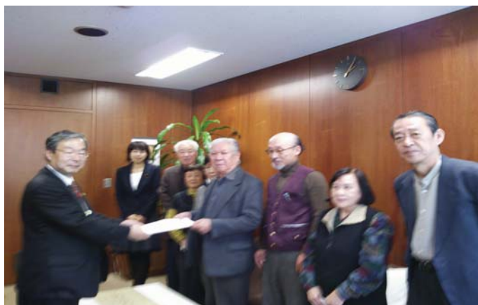
↑9日の申し入れの様子

申し入れには、退院をしたばかりの方も参加。また、出席者からは以下の実情が述べられました。 「希望丘団地を含む船橋地域は高齢化が進んでいる。 あるお宅では、ダンナさんの介護をしていた奥さんが入院。老老介護は、介護者が倒れたら、立ち行かなくなる。 跡地に特養ホームやショートステイをどうしても作ってほしい。」 区は「区長に伝えます」と回答しました。