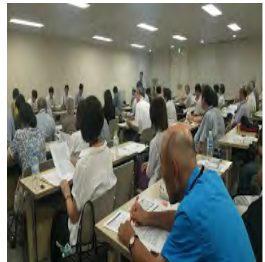
↑7 月 5 日の会による都交渉の様子