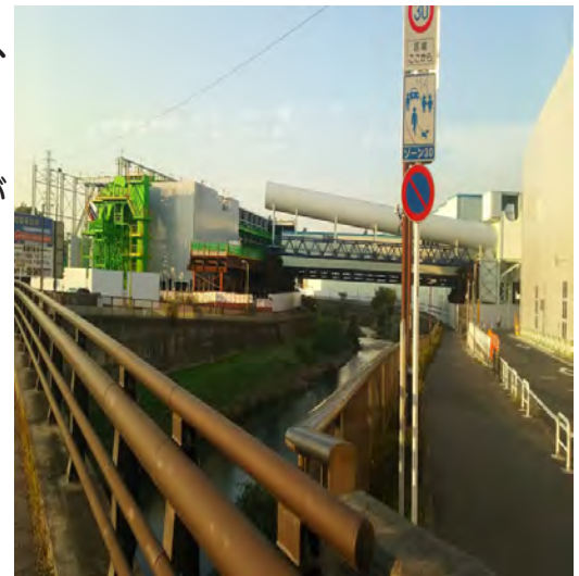
↑喜多見の大正橋より外環道工事現場を写す

住民の方々からは「事前環境アセスでは、換気塔より排気されたものは、成育医療センターに最も集まる」「近くに喜多見小学校などあり、子どもたちの影響が心配」「デザインコンクールをする前に、住民への換気塔についての説明会こそが必要だ」等々切実なお話を伺いました。