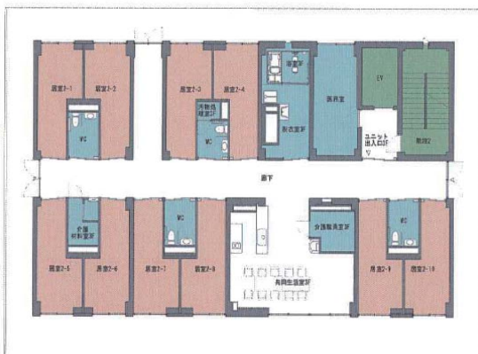
◇ハートハウス成城 平面図 例(3階)

区議団は「住み慣れた地域で介護が必要になっても暮らすために、小さな規模の特養ホームを27の街づくりセンターの地域ごとに作ろう」と、区民の方々と求めてきました。この度の第一号の開所は運動の成果です。しかし、この地域密着型特養ホームは事業採算が難しく、なかなか整備が進まないのも現状です。ひきつづき、小規模そして大規模の特養ホーム整備を求めていきます。