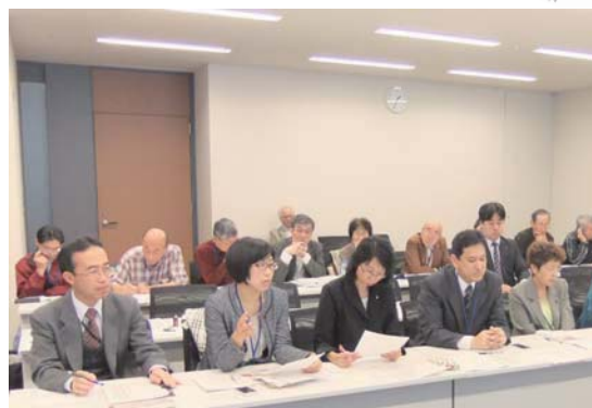
↑ 国交省レクの様子

議員・住民の方からは「説明になっていない」等何度も丁寧な説明を求めましたが、回答は変わりませんでした。