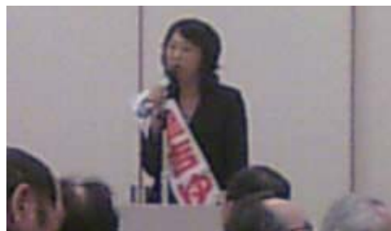
↑里吉 都議候補は、都政で保育園待機児・特養ホームの待機者をなくす役割を果たしたい、と訴えました