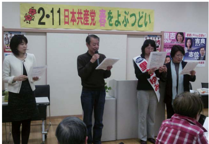
最後は全員で大合唱♪→

参加者代表として、千歳台在住 小学生のママ、玉川在住 二子玉川再開発反対運動をしている方、成城在住 外環道反対の運動をしている方、船橋在住 旧希望丘中跡地に特養ホームを作ってほしいと運動をしている方の発言がありました。