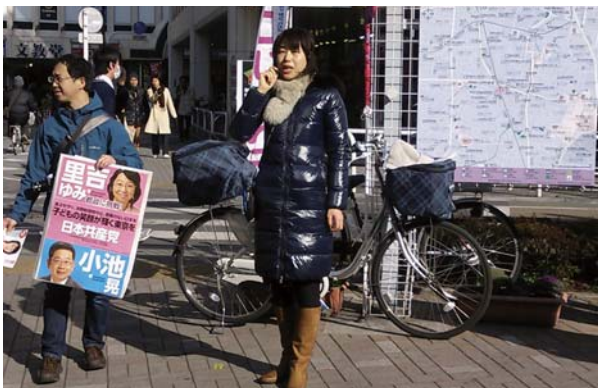
↑経堂駅での宣伝の様子。