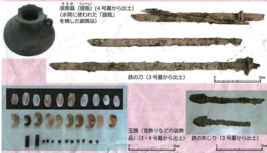
須恵器（提瓶）（4号墓から出土） （水筒に使われた「提瓶」を模した副葬品）

副葬品 横穴墓の中から、葬られた人の「人骨」とともに、お弔いをするために埋めた「副葬品」が見つかりました。副葬品は、鉄の刀や矢じりなどの「武器・武器類」、首飾りなどの装飾品などです。副葬品は葬られた人の地位を象徴するものですが、多くは後の時代に盗掘されてしまい、このように多く出土するのは珍しいようです。