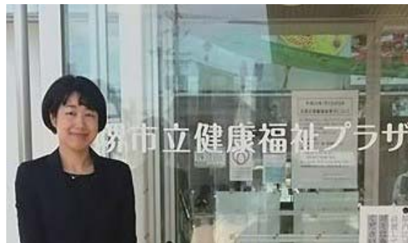
↑堺市の児童相談所がある複合施設の前にて

そして最終日は、広島県に「子育て応援事業」についてお話を伺いました。婚活事業にも精力的に取り組まれているということでした。